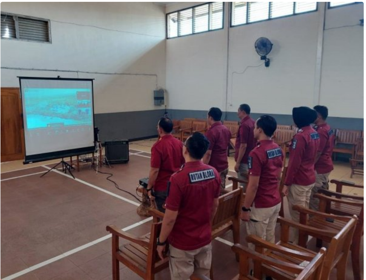
Rutan Blora Ikuti Webinar Series 5 Bersama BPSDM Hukum dan HAM

Blora – Rumah Tahanan Negara (Rutan) Kelas IIB Blora Kantor Wilayah Kementerian Hukum dan Hak Asasi Manusia (Kemenkumham) Jawa Tengah mengikuti Webinar Series 5 bertema “Powerful Coaching, Mentoring, dan Counseling untuk Perubahan Organisasi dan Pengembangan Kompetensi ASN.”